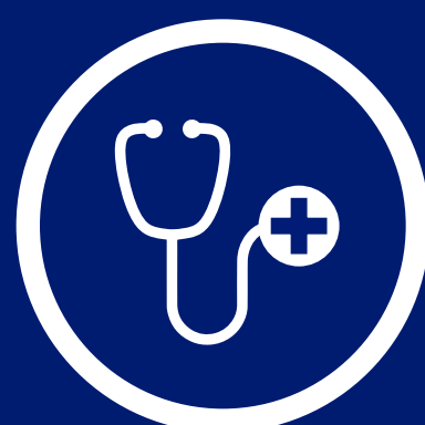
Sector médico, dental y oftalmico